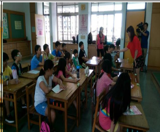
性平種子教師上課情形