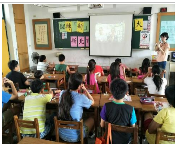
透過實際案例，探討性別意識