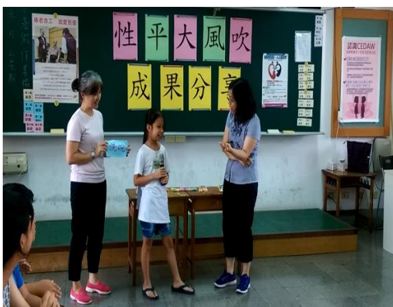
透過「性平大風吹」遊戲，從遊戲中學性平，讓學童分享對性別平等的想法，跳脫以往對性別的框架