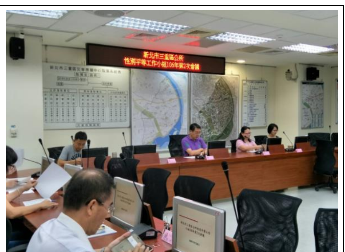
性別平等工作小組第 2 次會議