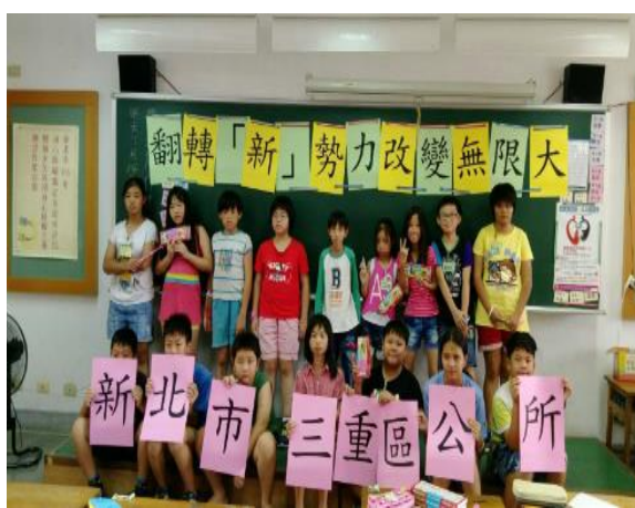
16位參與學童大合照